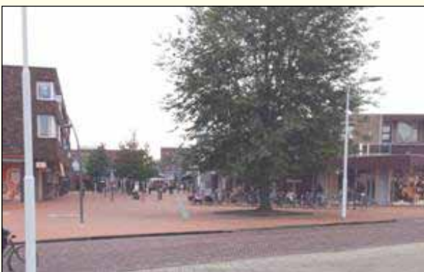
Foto: ingang winkelcentrum (Het Ruim) vanaf De Helling

In Dronten, zo blijkt uit de cijfers en onderzoeken, moeten we het vooral hebben van de relatief kleinschalige ondernemingen, waaronder ook winkeliers. We hebben een prachtig winkelcentrum met veel goede mogelijkheden.