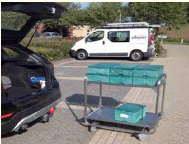
Foto: een prachtige voorziening: warme maaltijden in geïsoleerde dozen op weg naar de bewoners, die niet (meer) zelf voor de maaltijd kunnen zorgen.

Er is een trend ingezet om de oudere bewoner zo lang mogelijk thuis te laten wonen. LD vindt het een goede ontwikkeling. Dit moet dan mogelijk worden gemaakt door mantelzorg, de mogelijkheid tot inkoop van zorg, en faciliteiten zoals bijvoorbeeld Tafeltje Dek Je.