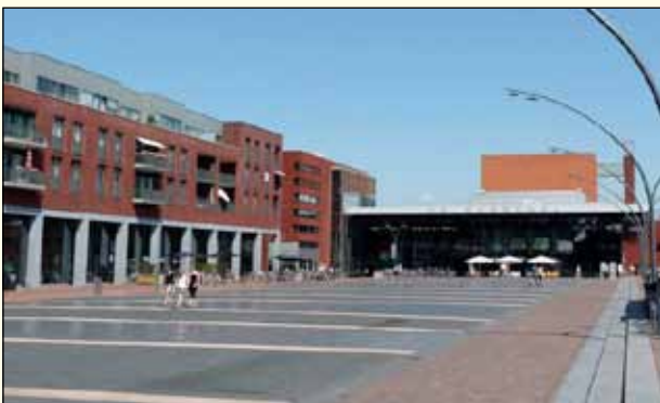
Foto: Het Redeplein na oplevering....veel méér reuring is er daarna niet meer geweest.....

LD is van mening dat het Redeplein een enorm obstakel is in het streven naar een gezellig "stadshart". Het is een groot leeg, dikwijls desolaat (verlaten) plein, waar de gezelligheid ver te zoeken is. De webcam, die op het gemeentehuis is geplaatst, biedt maar al te vaak een troosteloze aanblik. Het op deze wijze in stand houden heeft geen enkele toekomst. Het in de raadsperiode van 2010-2014 gehanteerde plan "de rede bruist" biedt wat LD betreft geen enkel toekomstperspectief meer en moet er in samenspraak met de ondernemers in het winkelcentrum de "Suydersee", nadrukkelijk naar andere mogelijkheden worden gezocht.