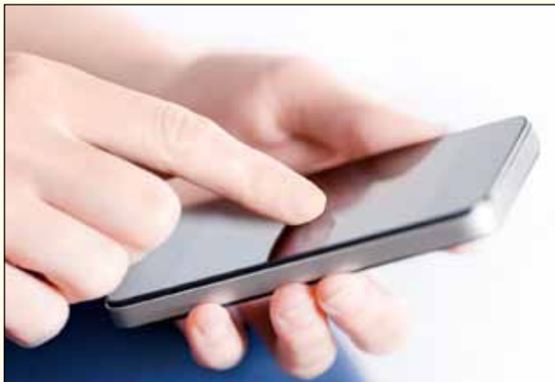
Foto: smartphone...en social media...een primaire levensbehoefte voor de jeugd...

Hoewel sommigen van mening zijn dat de welvaart en de “social media” verantwoordelijk zijn voor de houding van de jeugd van dit moment blijft de jeugd de toekomst. We zullen er alles aan moeten doen om ze, volgens de inzichten van het moment naar de toekomst toe, voor te bereiden. Ook voor de jeugd geldt dat de voorzieningen toegankelijk moeten blijven. De onderwijsvoorzieningen dienen, binnen de mogelijkheden die wij in Dronten hebben, zo breed mogelijk te zijn en ter voorbereiding van een plaats in de samenleving is een goede begeleiding naar werk ook erg belangrijk.