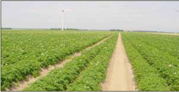
Foto: Dronten heeft een groot buitengebied met veel landbouw.....

De landbouw levert zelf, maar ook in de periferie (omgeving) daarvan, extra werkgelegenheid op. Die werkgelegenheid wordt voor een deel door werknemers gedaan die afkomstig zijn uit de MOE landen (Oost Europa). LD is van mening dat deze mensen op een goede en menswaardige wijze moet worden gehuisvest. Daar waar groepshuisvesting aan de orde is, kan dat alleen als overlast kan worden voorkomen en een eventueel noodzakelijke handhaving adequaat is. Omwonenden mogen hiervan niet de dupe worden. Een evaluatie zal moeten aantonen dat 300 personen per instelling een hanteerbaar aantal is. De verantwoordelijkheid en aansprakelijkheid geldt voor de eigenaar- beheerder van die groepshuisvesting, die door middel van een protocol verantwoordelijk is te houden voor de bewoners van de faciliteit.